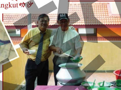
我们是一家人。 我们是Jangut叻沙的哥儿们