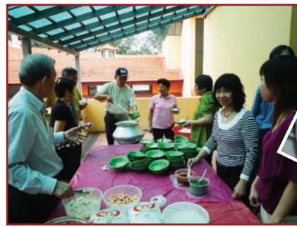
这就是顶尖美味和 可口的Jangut叻沙