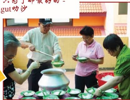
我们Jangut叻沙的专人在工作