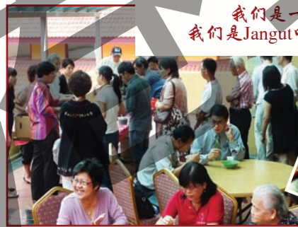
看看那人龙！只为了那最好的 - Jangut叻沙